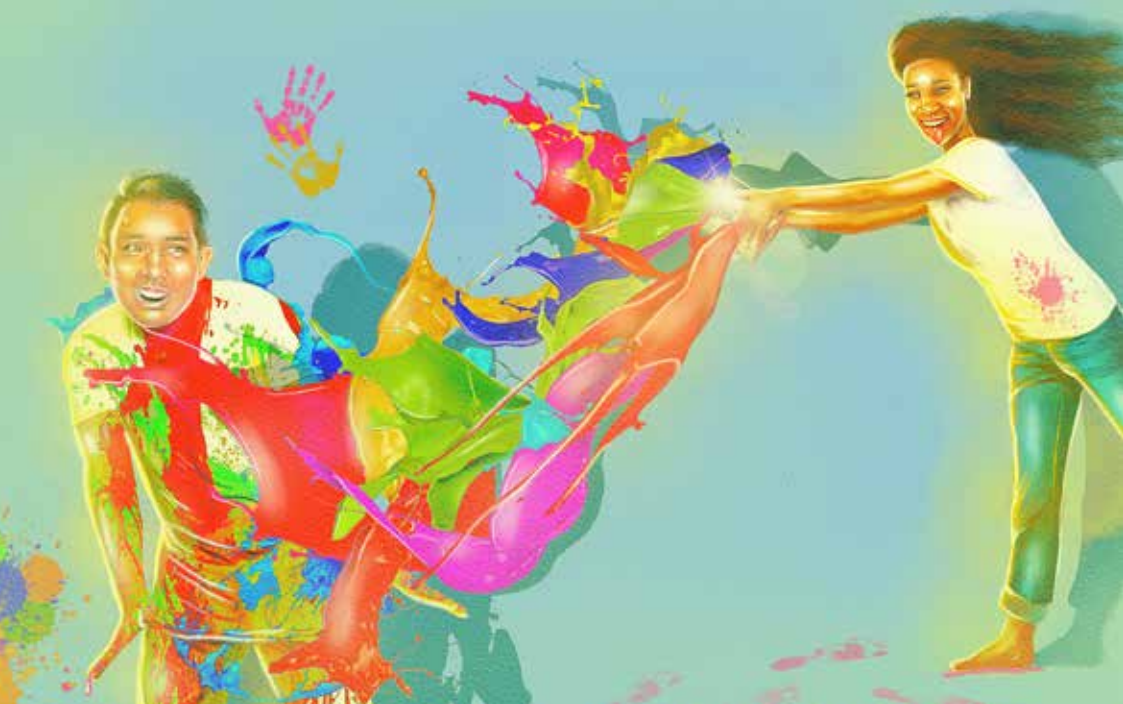
Illustration: Natalia Murobha

om sina respektive bakgrunder och konstnärskap.